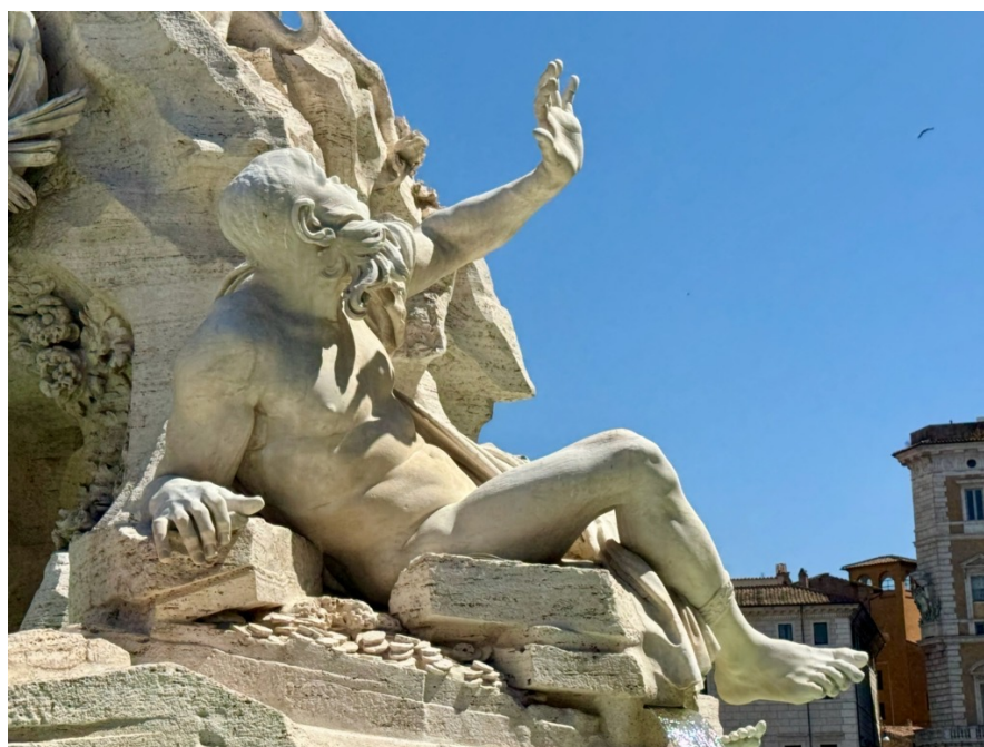
Place Navone, Rome

Cette affirmation de l'existence d'« âmes errantes » qui ignorent l'issue du jugement de Dieu à leur égard affaiblit le contenu du jugement particulier immédiat et engendre une confusion doctrinale. La foi catholique, fondée sur la Révélation divine, enseigne avec unanimité et clarté que chaque âme, au moment de la mort, comparaît immédiatement devant Dieu pour recevoir son jugement . Cette vérité est enracinée dans l'Écriture, soutenue par les grands théologiens de la tradition, réaffirmée par le Magistère le plus récent et protégée par le Catéchisme.