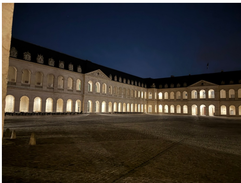
Hôtel des Invalides, Paris